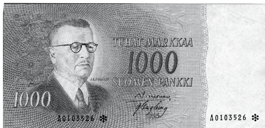
Kohde 314 (VL II)