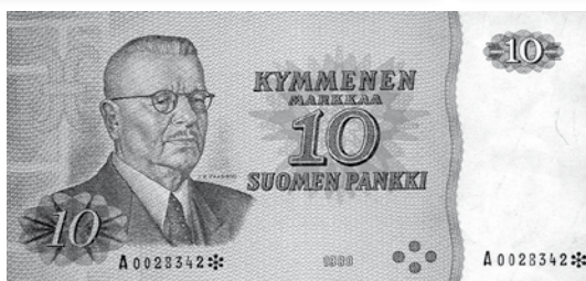
Kohde nro 154