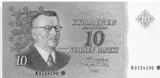
Kohde nro 140