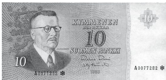
Kohde nro 138