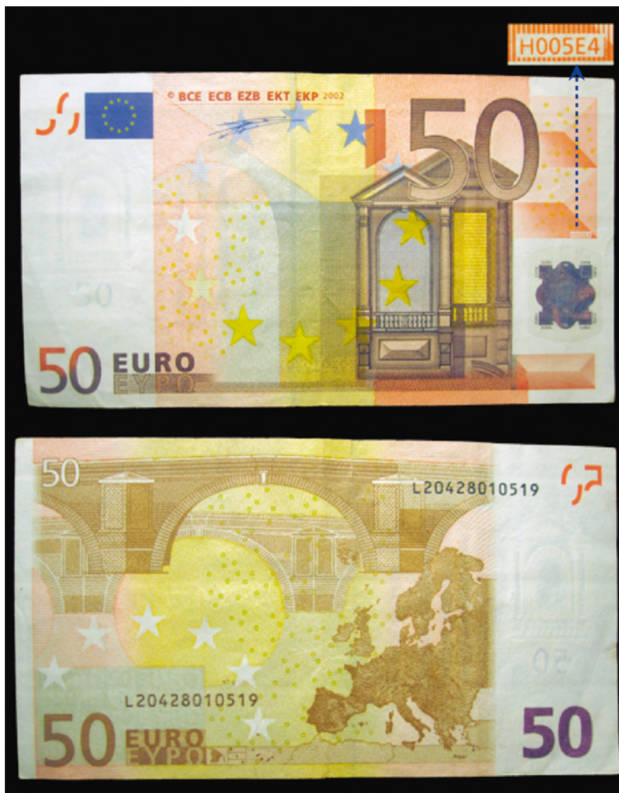
Kuva 3. 50€ L/H005 tilauserästä 204, painos tuntematon (RRRRR).

li 100€ L00101631***. Näiden lisäksi itse tutkailen seteleitä päivittäin toivoen löytäväni jonkun kadonneista painoeristä eli katselen 012 ja 036-040 -alkuisia L/D -seteleitä ja kaikki L140 -alkuiset kiinnostavat myös. Haasteita siis riittää!