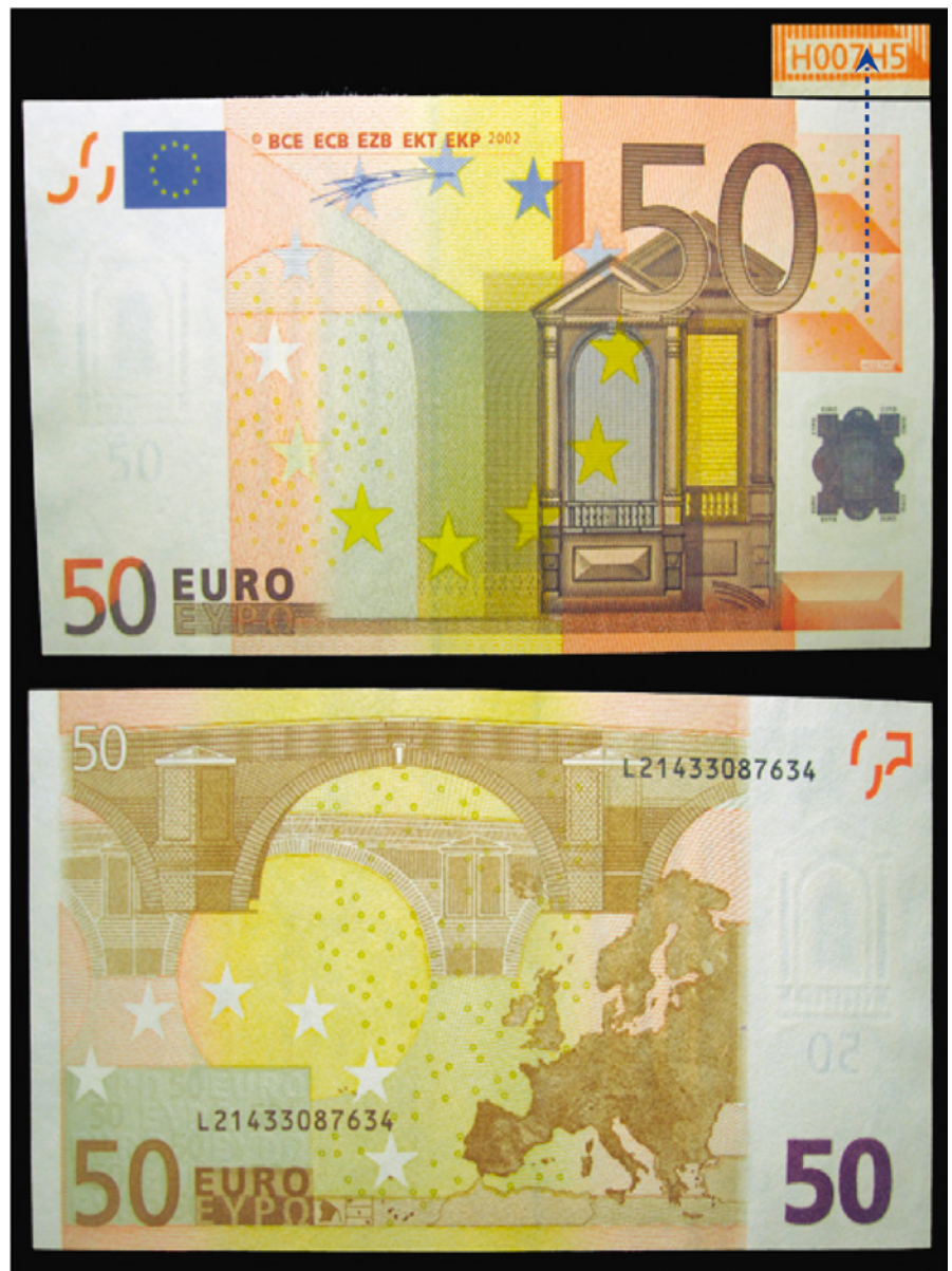
Kuva 2. 50€ L/H007 tilauserästä 214, painos < ½ miljoonaa (RRR)

50€ L/H005 syntyy on pienimuotoinen mysteeri. Setelit ovat ETN mukaan tehty kolmen tilauserän sisällä, nimittäin 204, 205 ja 211, mutta kaikki kokoelmakappaleet ovat eristä 204 tai 205. Itse epäilen vahvasti viimeistä ETN 211 painoerän seteliä virhesyötöksi, koska sen ja muiden H005 havaintojen välillä on vuosia ja muiden synty näyttää tapahtuneen hyvin lyhyenä hetkenä painoerien 204 ja 205 vaihteessa. Näyttää siltä, että H005 painolaatilla tehtyjä arkkeja olisi painokoneeseen pääsyt juuri 204 erää lopetettaessa ja 205 erää aloitettaessa – olettaen, että ensin on painettu isot arkinumerot. Tästä välistä löytyy kuitenkin myös